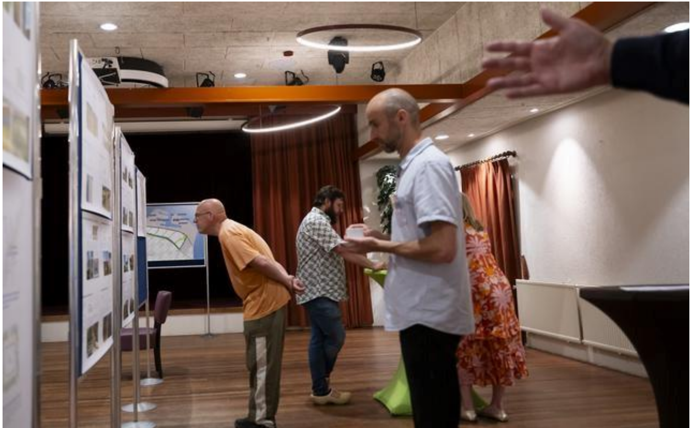
Bewoners turen aandachtig naar de plannen met de Oostpolder.

De provincie Groningen presenteerde maandagavond de plannen voor de Oostpolder aan bewoners uit het gebied. Niet iedereen was enthousiast. Sterker nog: belangengroep BBE diende een klacht in tegen gedeputeerde Bram Schmaal en wil niet meer met hem in gesprek.